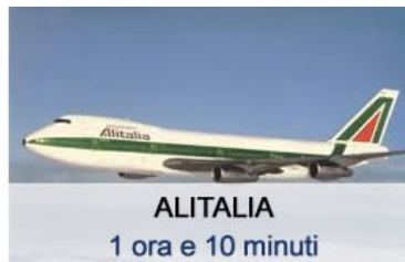
ALITALIA 1 ora e 10 minuti