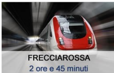
FRECCIAROSSA 2 ore e 45 minuti