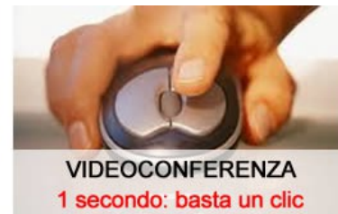
VIDEOCONFERENZA 1 secondo: basta un clic